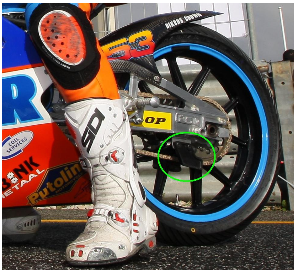
Obrázek č.1 - Kryt náběžného místa řetězu na rozetu